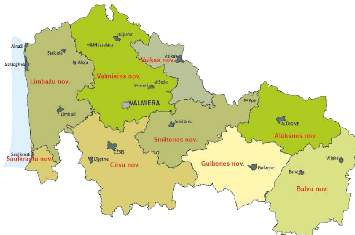
Attēls 2-1 Vidzemes AAR – administratīvi teritoriālais iedalījums